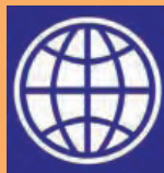
ធនាគារពិភពលោក